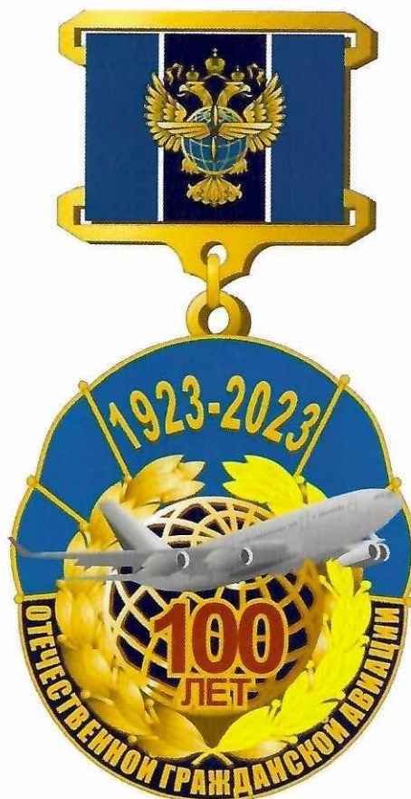
Рисунок памятного нагрудного знака «100 лет отечественной гражданской авиации»

Приложение № 3 к Положению о памятном нагрудном знаке «100 лет отечественной гражданской авиации», утвержденному приказом Федерального агентства воздушного транспорта от 10 ноября 2022 г. № 164-Н